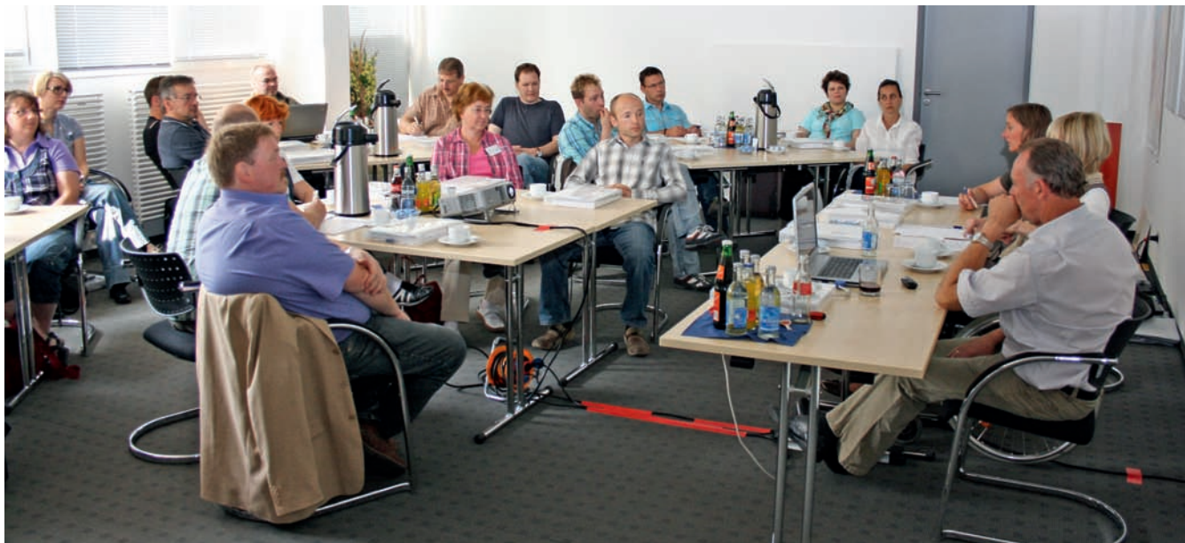
Das Seminar stieß auf reges Interesse.