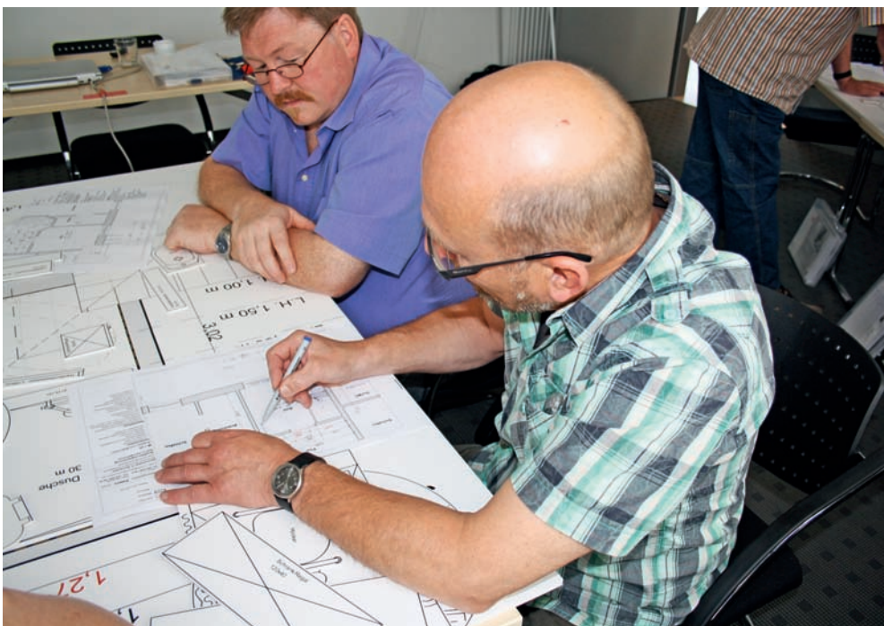
Praktische Planungsaufgabe: ein Bad barrierefrei umzugestalten.

www.nullbarriere.de www.planungsbuero-peters.com www.uta-kurz.de www.hsk-duschcabinebau.de